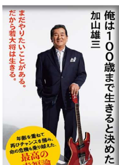
新潮新書 ¥760 (税別)

【プロフィール】父親が上原謙、母親が小桜葉子という有名芸能人一家に生まれたサラブレッド。病弱だった理由で2歳の時に田園調布から茅ヶ崎に引越しました。本書の中でも「茅ヶ崎の海が俺を育ててくれた」と述べて